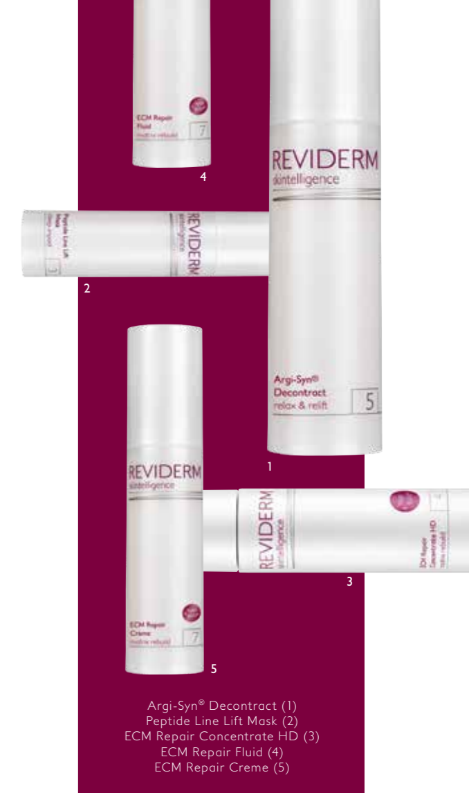
Argi-Syn® Decontract (1) Peptide Line Lift Mask (2) ECM Repair Concentrate HD (3) ECM Repair Fluid (4) ECM Repair Creme (5)

RE-STRUKTURIEREND: ECM Repair Creme. Reichhaltige 24-Stunden-Regenerationscreme für mehr Spannkraft. Der enthaltene Wirkstoff MatriFirm® glättet Linien und Fältchen sichtbar, die Haut erhält ihre jugendliche Ausstrahlung zurück.