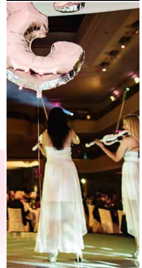
Virtuosity meets sexiness: Das Frauen-Streichquartett Munich Strings hat den Bogen raus.