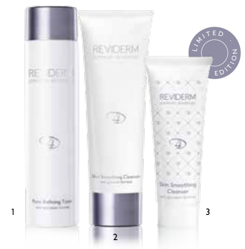
REVIDERM PREMIUM REINIGUNG Pore Refining Toner (1) Skin Smoothing Cleanser (2) Miniatur Skin Smoothing Cleanser (3)