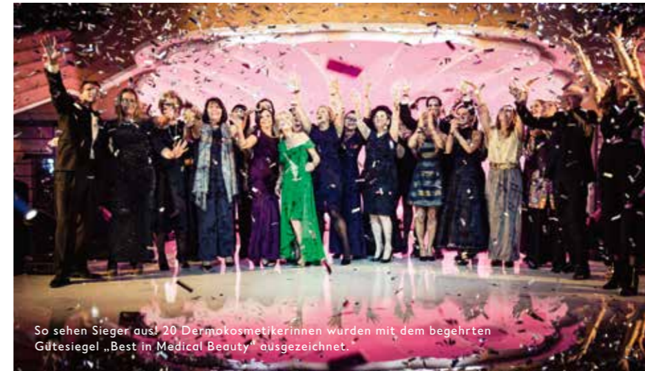
So sehen Sieger aus! 20 Dermokosmetikerinnen wurden mit dem begehrten Gütesiegel „Best in Medical Beauty“ ausgezeichnet.