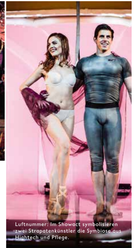
Luftnummer: Im Showact symbolisieren zwei Strapatenkünstler die Symbiose aus Hightech und Pflege.